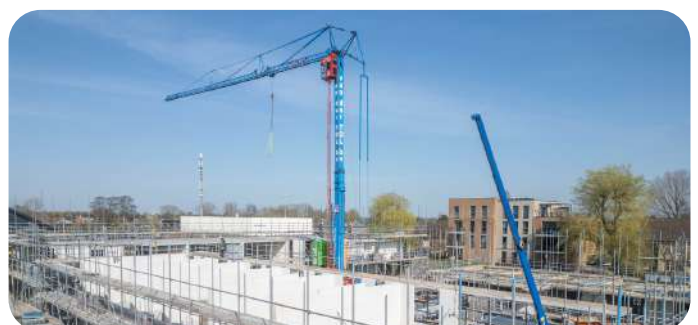
De oplevering van De Opkamer biedt nieuwe mogelijkheden voor inwoners.

Het actieplan voor 2026 is te lezen op onze website.