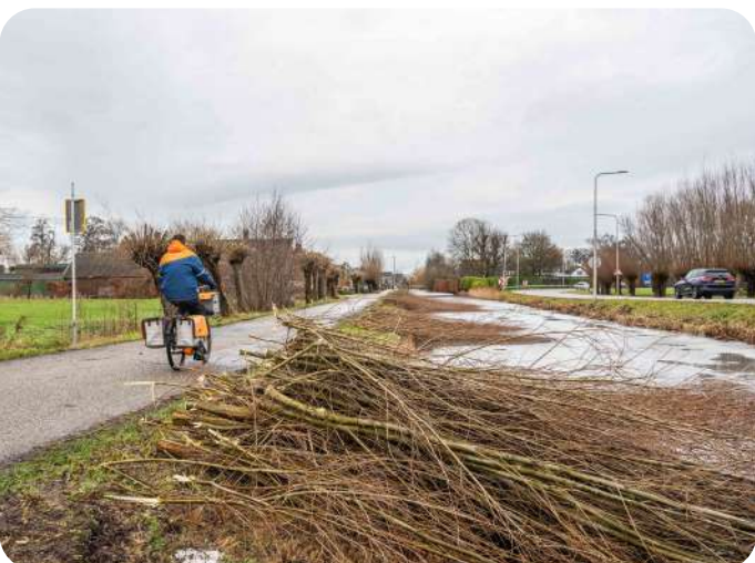
LANGS HET FIETSPAD WERD AFGELOPEN TIJD WEER FLINK GEKNOT