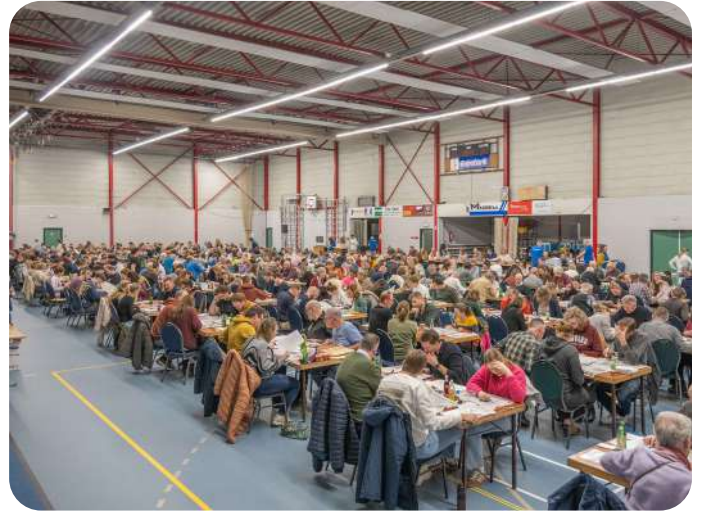
HET VERENIGINGSPEL IS GEWONNEN DOOR DOOR TEAM A VAN DE ZWAANTJES. DE TWEDE PRIJS GING NAAR TEAM B.