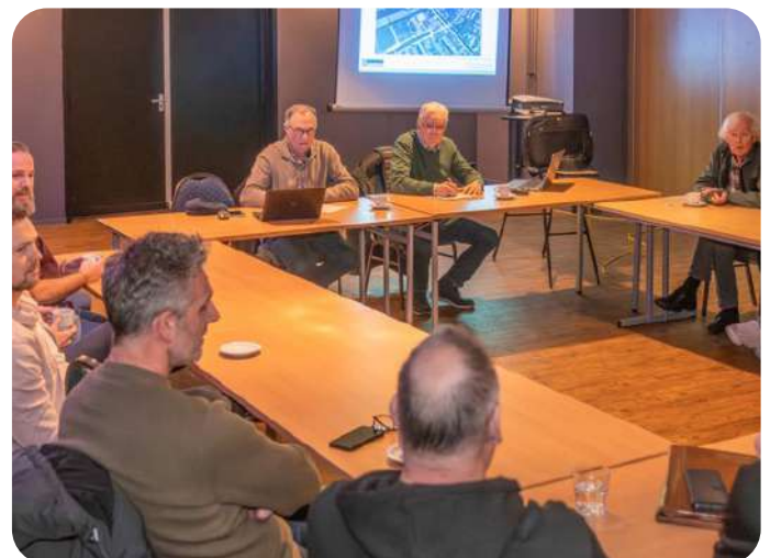
BESTUUR DORPSHUIS IN GESPREK MET GEBRUIKERS, OVER DE PLANNEN VOOR DE NABIJE TOEKOMST