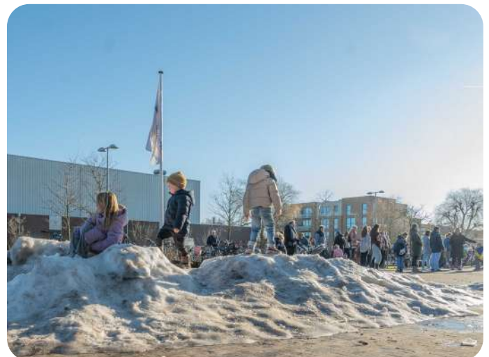
EEN PRACHTIGE SNEEUWHOOP BLEEF LEKKER LANG LIGGEN VOOR DE SCHOOLDEUREN!