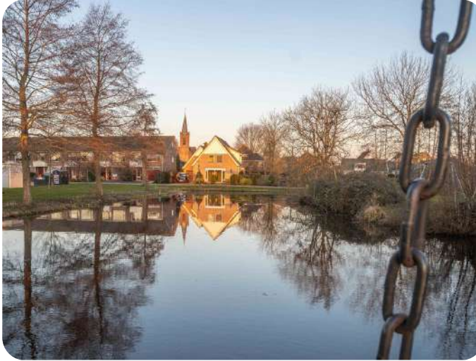
SPIEGELEND TIJDENS ZONSONDERGANG