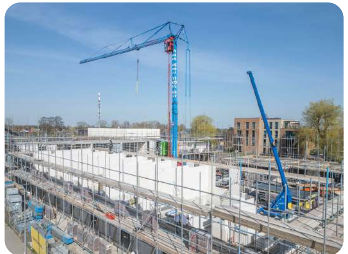
PROJECT DE OPKAMER VORDERT GESTAAG