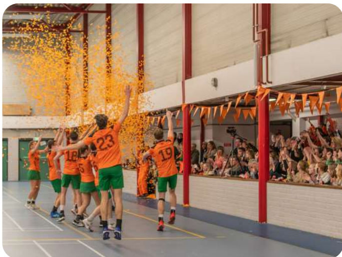
SDO/FIABLE 1 SPEELDE ZICH RECENT VEILIG IN DE OVERGANGSKLASSE