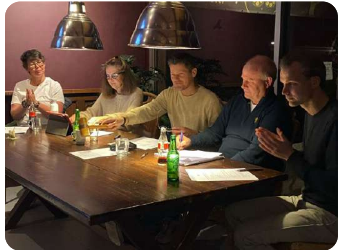
Boven: de Voorzitter bevestigt de uitslag van de stemming met een hamerslag. Onder: de geplande plek van aanleg en het technisch plan.

“Ik kijk er echt naar uit om bij mijn eigen club te gaan padellen. Nu speel ik af en toe op andere banen. Ik blijf echter ook graag tennissen en kijk al weer uit naar de Voorjaarscompetitie en ons Open toernooi.”