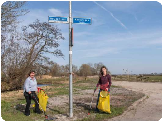
VRIJWILLIGERS TIJDENS DE JAARLIJKSE ACTIE KAMERIK SCHOOL